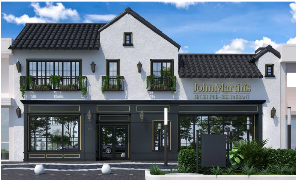
Facade of the renovated restaurant in Coral Gables JohnMartin's.

The place at Miracle Mile has been redesigned Bigtime Design Studios and its two floors and 7,000 square feet pay tribute to the original JohnMartin's