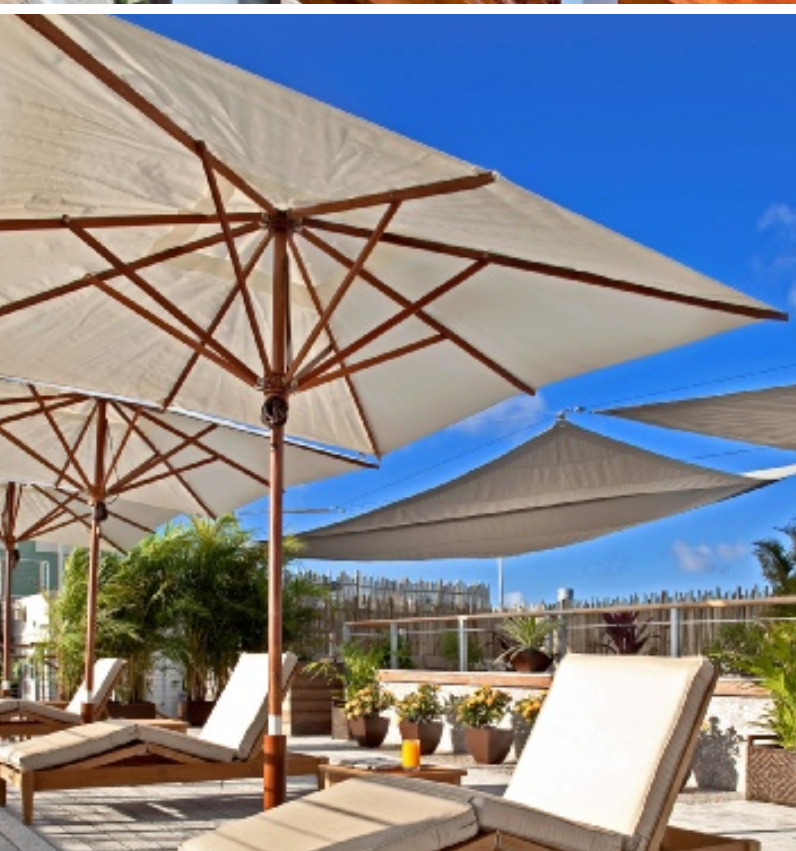
CONSENTIDOS Además de los camastros y sombrillas, a la orilla de la alberca hay toallas faciales heladas y fruta para los visitantes.

Íntimo y acogedor, The Betsy recibe a sus visitantes con un ambiente que recuerda las plantaciones coloniales con detalles como persianas blancas de madera, techos tapizados de rafia, elegantes sábanas Frette, bocinas y cargador para el iPod, así como televisión de pantalla plana.