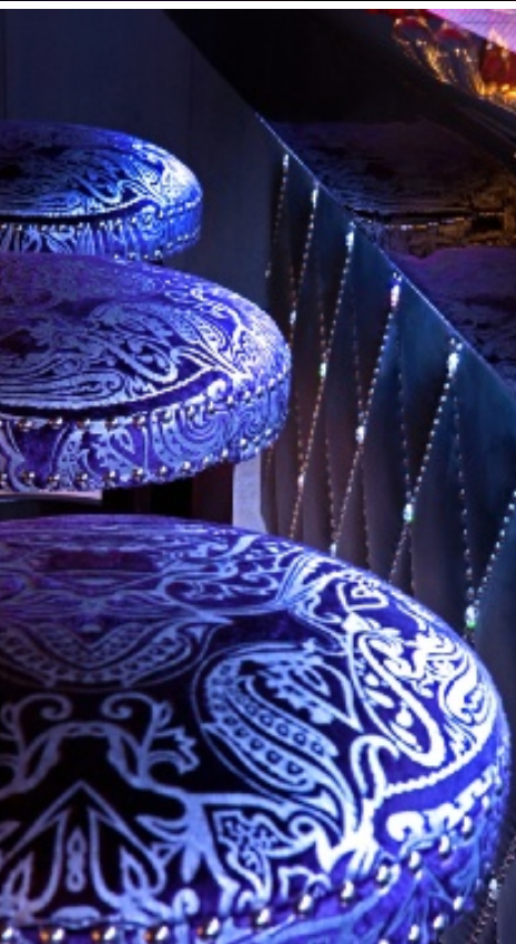
Confesía The Betsy Hotel

La terraza en el techo de este pequeño hotel, con sólo 63 habitaciones y suites, ofrece un servicio de spa al aire libre, en el cual se pueden recibir relajantes masajes sintiendo los rayos del sol y la fresca brisa que llega desde el mar.