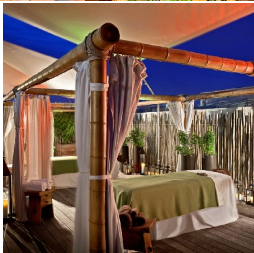
RELAX AL AIRE LIBRE El servicio de spa del hotel ofrece masajes relajantes arropados por la agradable brisa marina atlántica.

Si se prefieren las aguas del Atlántico, el hotel cuenta con un servicio de mayordomos listos para ofrecer tumbonas de playa, toallas y sombrillas.